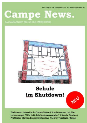
Magazin "Campe News"

Die Schülerinnen und Schüler lernen hier, wie in einer Print- und Online-Redaktion gearbeitet wird, und beschäftigen sich darüber hinaus mit den zentralen Aufgaben, Tätigkeiten und Prozessen, die mit der praktischen Umsetzung von Medienprodukten verbunden sind: angefangen bei der Recherche , dem Fotografieren und Texten über Konzeption , Layout und Anzeigenakquise bis hin zu Buchhaltung und Vertrieb .